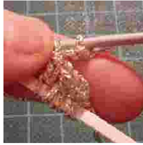
en steek in de derde losse