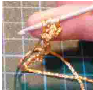
Draai om en maak in de tweede losse 1 vaste , 3 stokjes en 1 vaste..