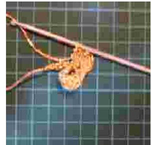
herhaal dit in elke losse