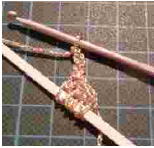
maak 3 losse .