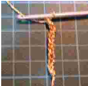
Haak 12 losse.