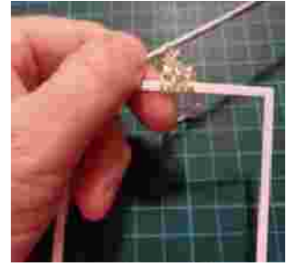
en maak dan een halve vaste